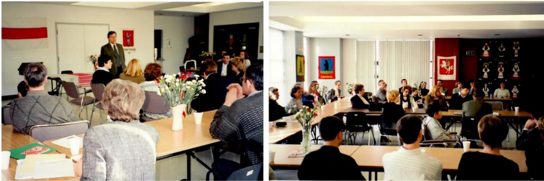
25 сакавіка 2001, Атава, Hindenburg Family Centre