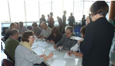
Атава, City Hall, 2013