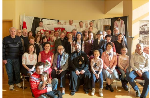
Агульны здымак Атава, 6 красавіка 2019