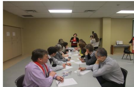
Атава, Hintonburg Family Centre, 2014