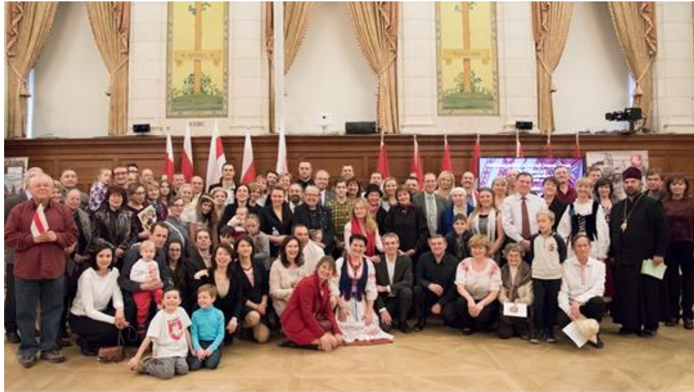
Агульны здымак, Атава, будынак Парламента Канады, 11 сакавіка 2018 года