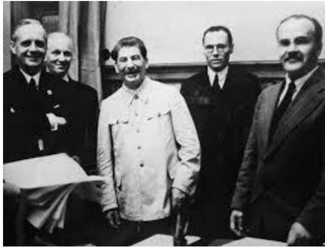
J. von Ribbentrop, J. Stalin and V. Molotov after signing the Nazi-Soviet Non-aggression Pact in Kremlin, Moscow, August 23, 1939

Пакт Рыбентропа-Молатава, гэта неафіцыйная назва дамовы аб ненападзе, заключанай паміж Германіяй і СССР, і падпісанай 23 жніўня ўвечары ў Маскве міністрам замежных спраў Германіі Іаахімам фон Рыбентропам і савецкім міністрам замежных спраў Вячаславам Молатавым. У дадатак да заявы аб ненападзе, дагавор уключаў сакрэтны пратакол, які ня быў вядомы на працягу доўгага часу, паводле якога Цэнтральная і Усходняя Еўропа была раздзелена на дзве зоны ўплыву - савецкую і нямецкую: пад раззел траплялі тэрыторыі Польшчы, Румыніі, Літвы, Латвіі, Эстоніі і Фінляндыі. У якасці непасрэднага выніку гэтай дамовы, Германія напала на Польшчу з трох напрамкаў (захад, поўнач і поўдзень) 1 верасня 1939 года. Пасля савецка-японскага перамір'я, якое пачалося 16 верасня, Савецкі Саюз таксама ўварваўся ў Польшчу (з усходу) 17 верасня. 30 лістапада, савецкія войскі напалі на Фінляндыю (крывая зімовая вайна 1939-1940 гг.). Пакт Рыбентропа-Молатава перадзяліў карту Еўропы, якая была складзена пасля Версальскай дамовы ў 1919 годзе, правёў да пачатку Другой сусветнай вайны і наступнае халоднай вайны.