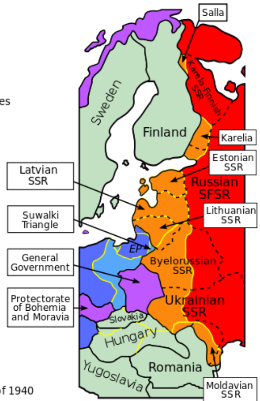
Planned and actual changes of territories in 1939-1940 time frame (Wikipedia)