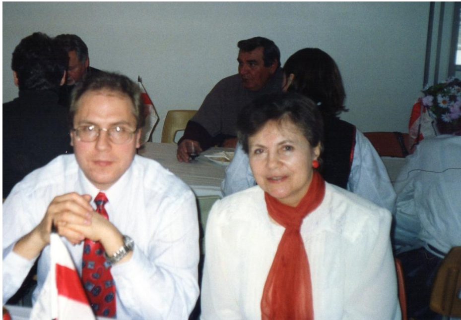
Вольга Іпатава з сынам Русланам на святкаваньні 25 Сакавіка ў Манрэалі (30 красавіка 2003 года)

Рэдакцыя часопіса “КУЛЬТУРА, НАЦЫЯ” шчыра віншуе вядомага беларускага літаратара і грамадскага дзеяча, Вольгу Міхайлаўну Іпатаву, з юбілеем і зычыць ёй добрага здароў’я, шчасся, дабрабыту яе сям’і і далейшых творчых поспехаў на карысць Бацькаўшчыны.